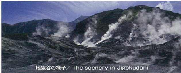
地獄谷の様子 / The scenery in Jigokudani