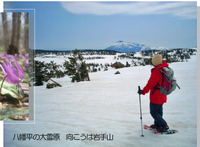
八幡平の大雪原 向こうは岩手山