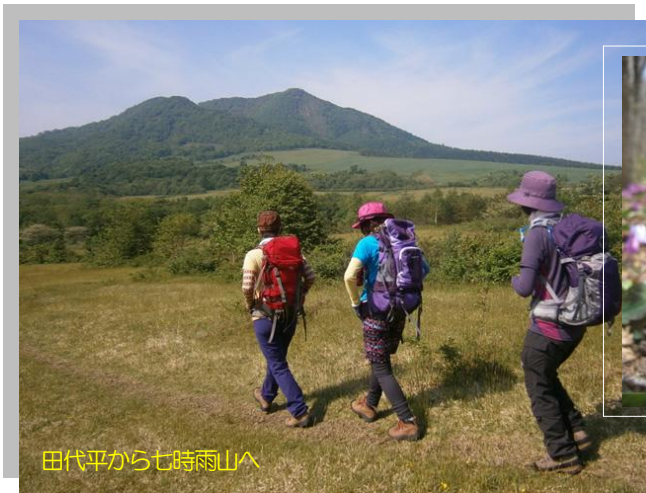
田代平から七時雨山へ

これから山歩きを始めたい人、春からの山登りに自信がない人、ぜひ一度一緒にしませんか。 少人数 びっくりするほど疲れない 山歩きの基本がわかる 山の風は、そんなガイド登山をしています！